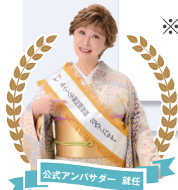
公式アンバサダー 就任

関東財務局長(少額短期保険)第38号 あんしん少額短期保険株式会社 〒330-0854 埼玉県さいたま市大宮区桜木町 1-11-7